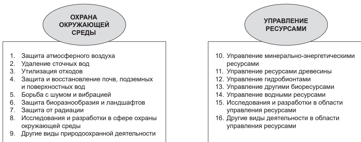
Рис. 1. Классификация ППТУ по направлениям природоохранной деятельности