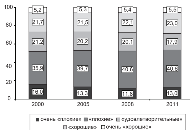
Рис. 2. Распределение работников по рабочим местам разного качества в Российской Федерации в 2000-2011 гг. (в % к итогу)

Распределение работников на основе информации об их среднегодовой численности по заполненным рабочим местам разного качества (на вакансии в 2010-2012 гг. приходилось менее 3% списочного персонала) показано на рис. 2.